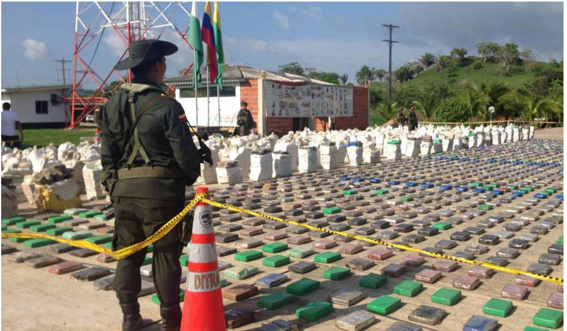
Decomisos de cocaína en Colombia al por mayor.

Colombia ha incautado este año más de 567 toneladas de cocaína, 20 % más que en 2023