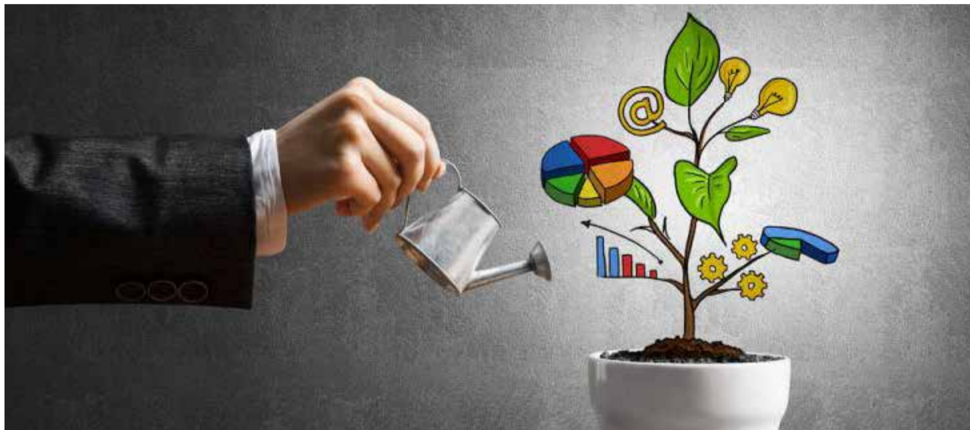
Metas a corto plazo