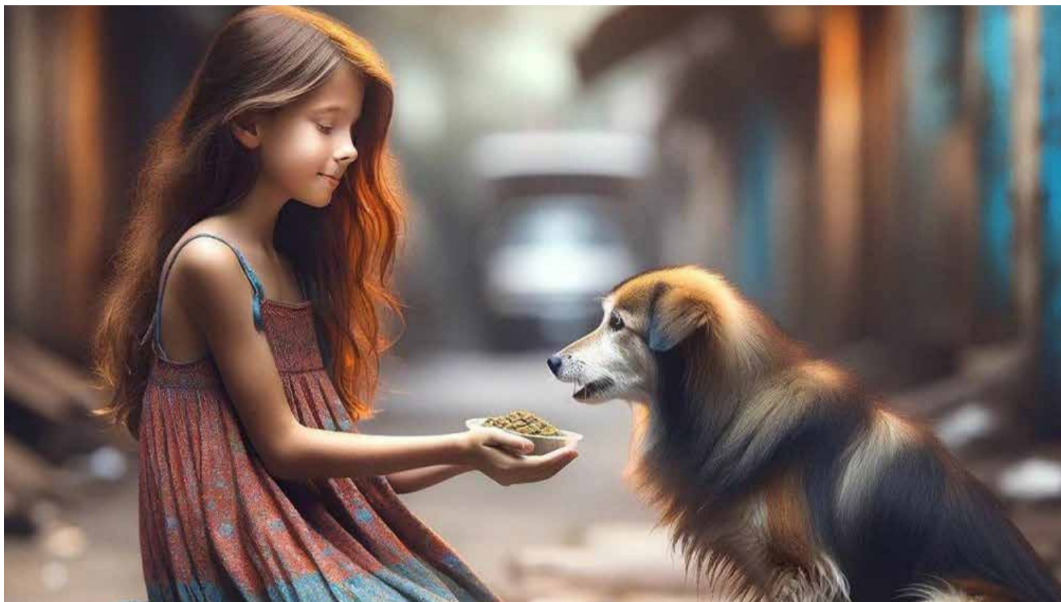
Gratitud con humildad