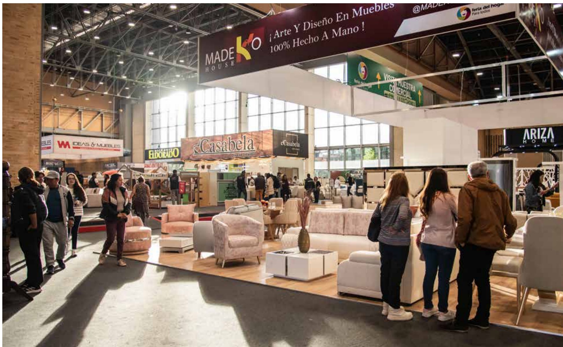
Feria del Hogar