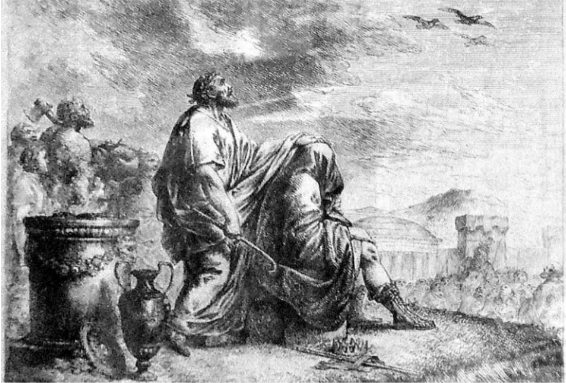
La adivinación y los adivinadores han estado presentes en la historia de la humanidad.