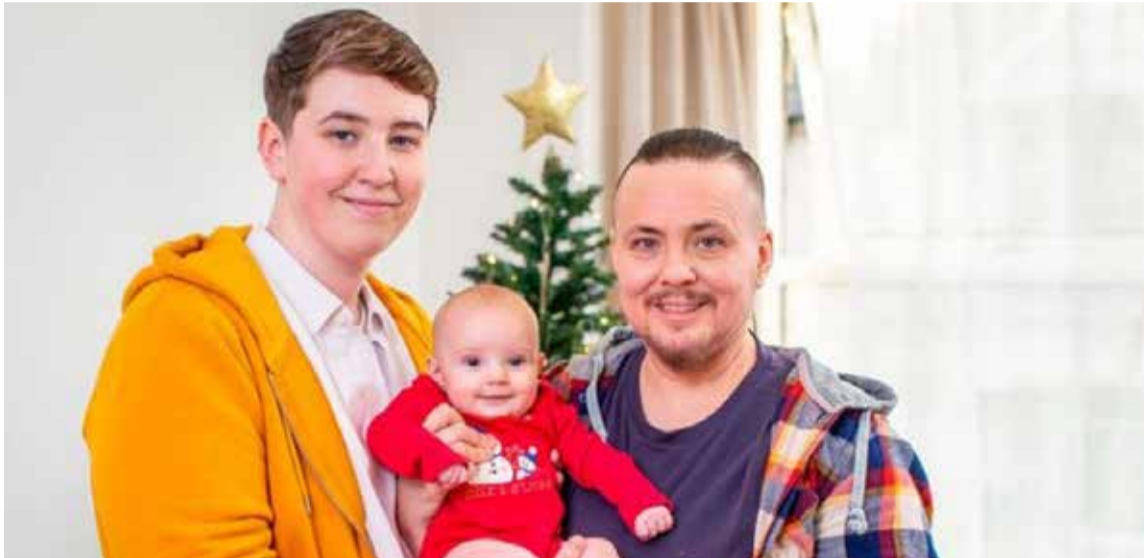
Visibilidad de la diversidad sexual