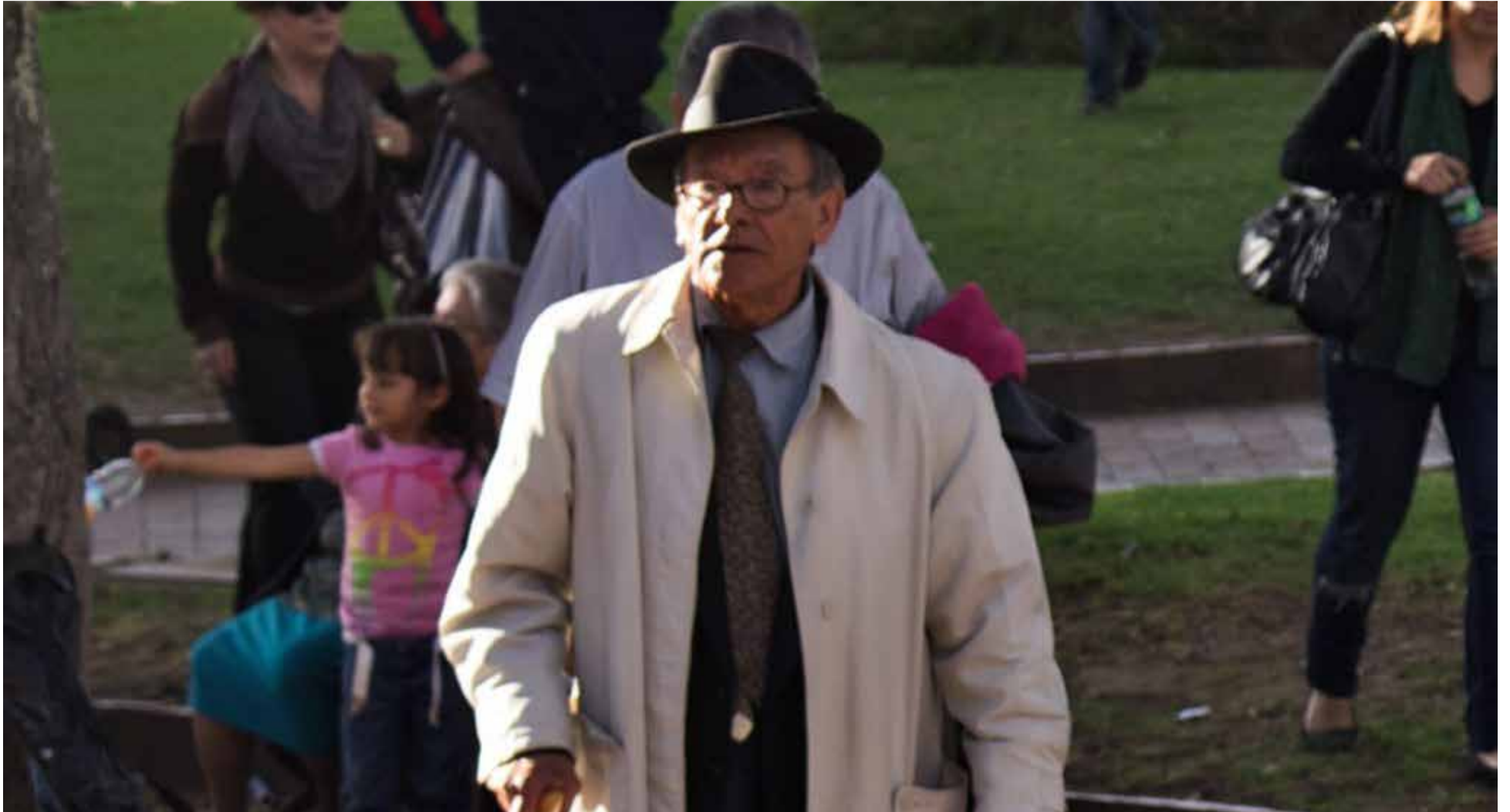
El típico cachaco