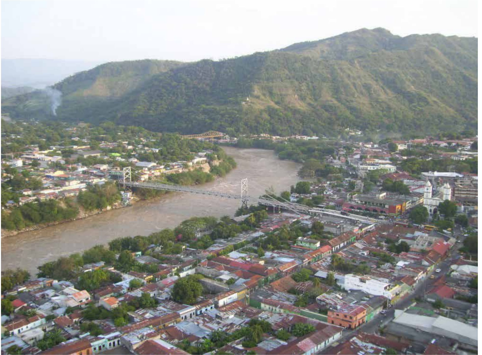
Algunas cifras reveladoras: Colombia tiene 24 mil kilómetros de ríos; por lo menos 18 mil son navegables y el país ocupa el sexto lugar mundial en longitud aprovechable para operaciones fluviales.

la Terminal pública para pasajeros. La habilitación del Magdalena favorece a empresarios del carbón, petroleros e industriales diversos, vinculados a los Tratados de Libre Comercio suscritos por Colombia con países del Viejo Mundo, asiáticos