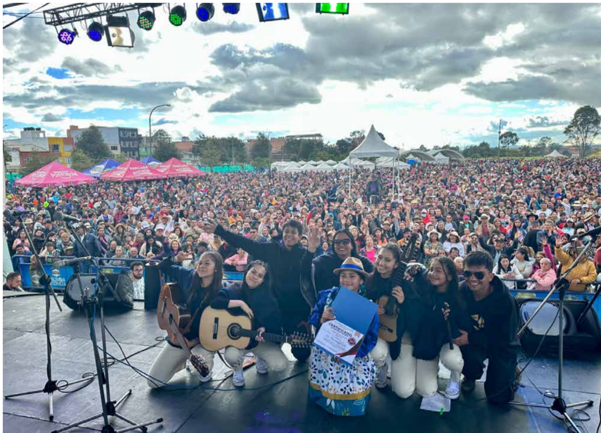
Música de Boyacá para Bogotá