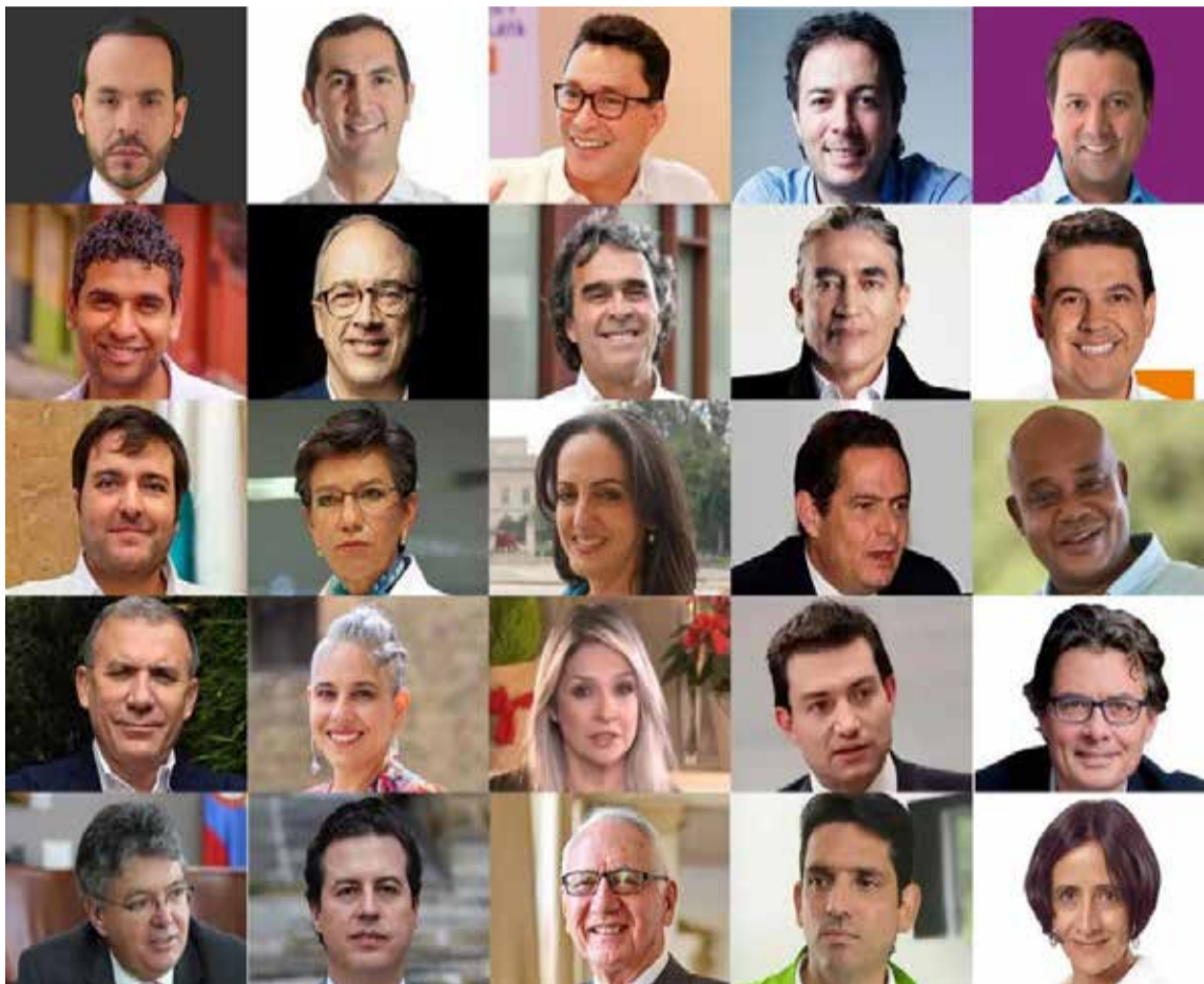
Algunos de los 45 precandidatos presidenciales.

En Colombia, los partidos políticos están inmersos en la tarea de escoger a sus candidatos para el Congreso y la presidencia de la República. La metodología varía dependiendo del tipo de partido. Los partidos de masas, generalmente de izquierda, suelen restringir las candidaturas a sus miembros más antiguos. Este enfoque impide que personalidades indepen-