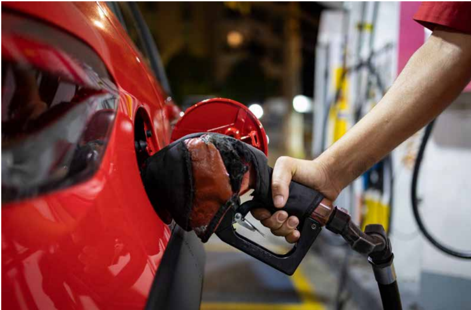
Nuevos precios del ACPM en Colombia.