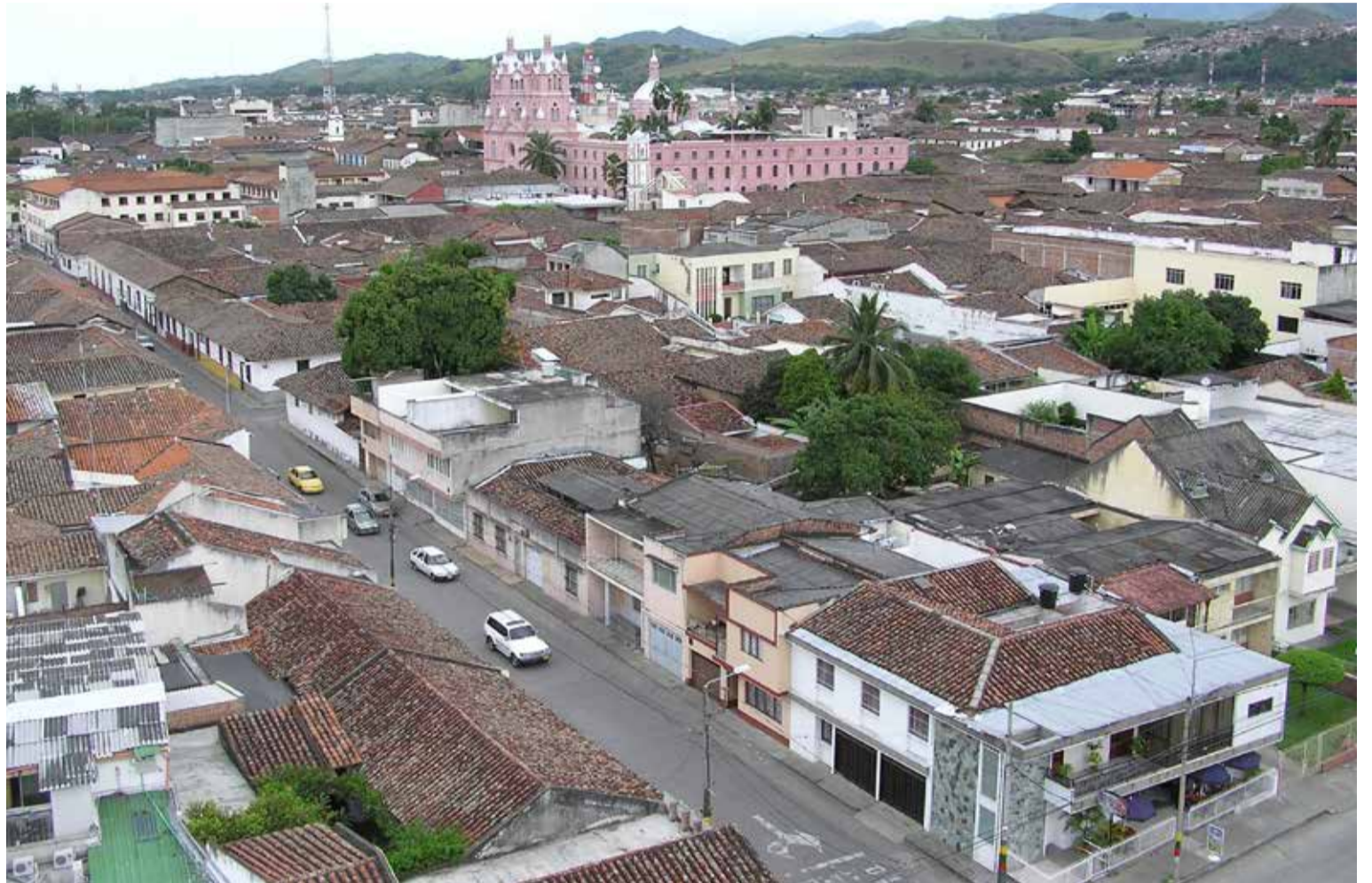
Buga Valle del Cauca

Peyorativamente se ha dicho de Buga que es la ciudad de los papayos porque, por su endogamia ancestral, los ricos hacendados bugueños, desde la Colonia hasta por lo menos la mitad del siglo anterior, tenían en los solares de su casas señoriales un palo de papaya sembrado para poder amarrar al bobo que existía en casi todas los hogares entrecruzados una y otra vez con parentela.