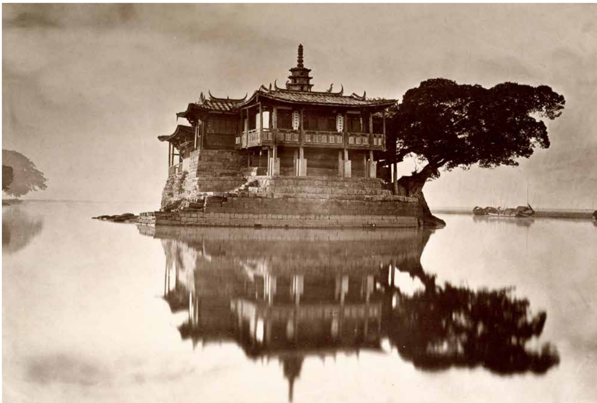
Isla Pagoda en la desembocadura del río Min – Foto de John Thomson .