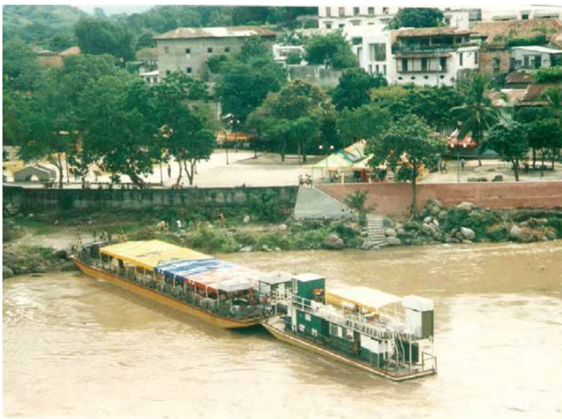
La recuperación del río Magdalena que no parta de la histórica ciudad de Honda es desconocer el desarrollo geo socioeconómico de Colombia e Indoamérica

Es tal la importancia del Magdalena, que, en el